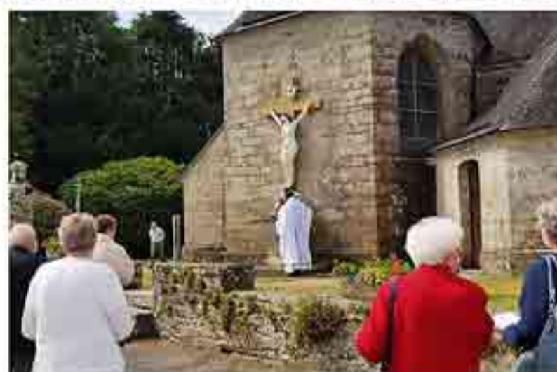
Bénédition le jour du Pardon

La promesse de l'inaugurer solennellement à l'occasion du pardon est tenue : la nouvelle Croix et le Christ restauré sont inaugurés et bénis le 15 août 2020.