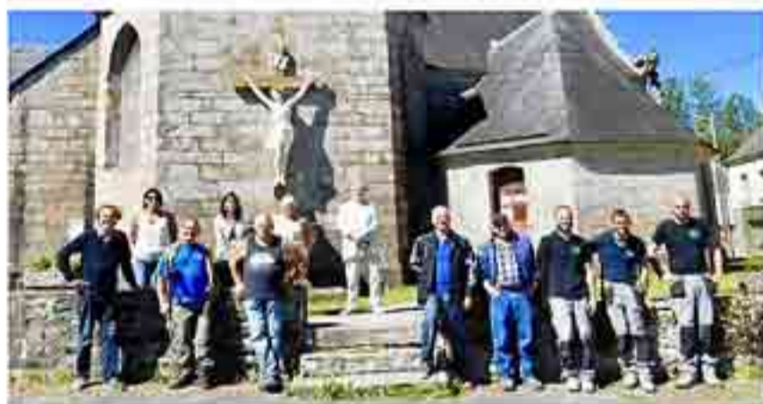
Agents municipaux et équipe paroissiale