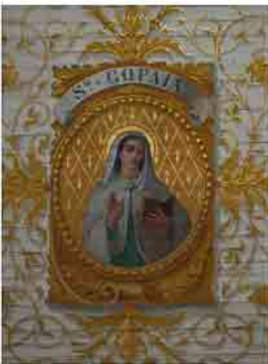
Lambris église de Langoat

Sainte Pompée ( français ), Pompae ( latin ), Koupaïa ( bzh ), le cantique de Langoat nous apprend qu'elle s'appelait aussi Aspazi. Elle est fêtée le 2 janvier pour certains et le 26 juillet pour d'autres.