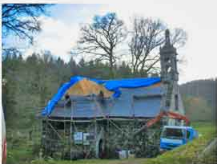
La Trinité le 25 janvier 2022

Le dossier des travaux inachevés de sculpture des entrails et corniches suit son cours à la DRAC. Elle prévoit un déplacement à La Trinité. « L'affaire » ne devrait donc pas être abandonnée ce qui rassure - dans la tourmente - les Amis de la chapelle.