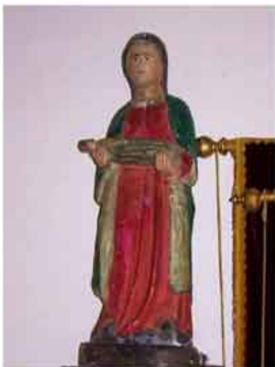
Sainte-Brigitte N-D du Krann Spezet

Il existe deux saintes Brigitte, celle de Suède fêtée le 8 octobre et celle d'Irlande.