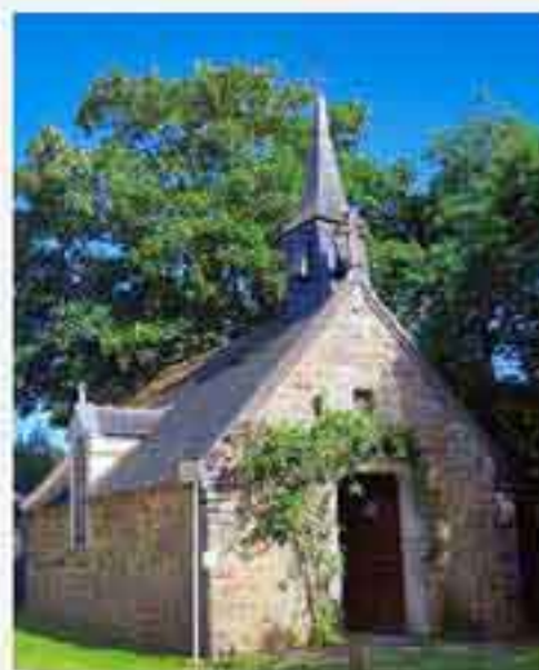
Ste-Anne Le Sel de Bretagne

Breiz Santel compte sur la fidélité de ses adhérents ( et la venue de nouveaux ! ) pour poursuivre son action. Nous joignons ici un bulletin d'adhésion . Merci d'avance !