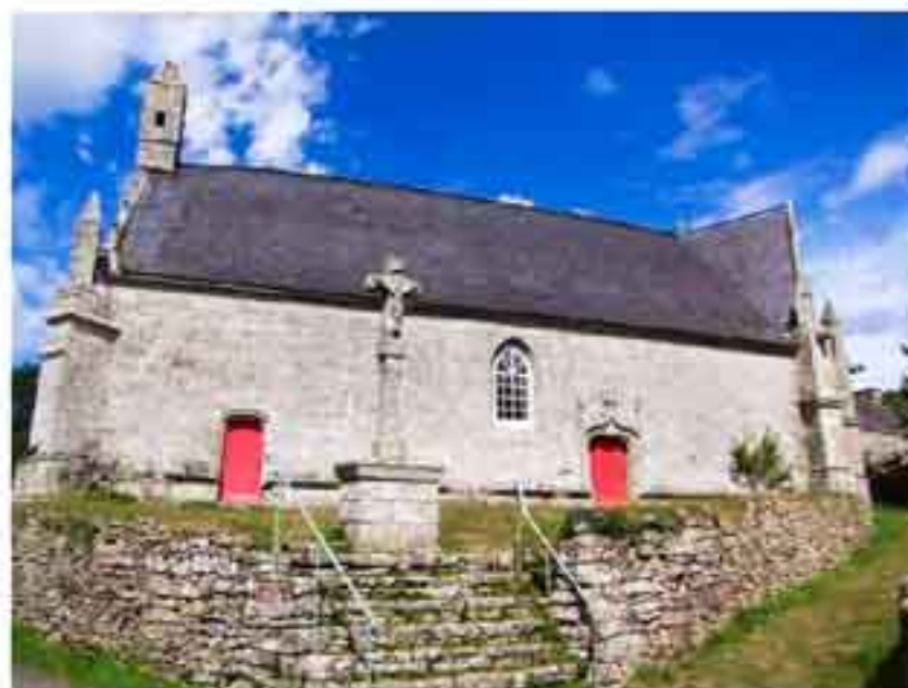
Chapelle Ste-Brigitte Grand-Champ

Chapelles : Merdrignac, Ploumagoar, Saint-Cast le Guido (22) Benodet, Esquibien, Guengat, Motreff, Saint-Thegonnec (29) Erdeven, Grand-Champ, Maizin, Pluvigner (56)