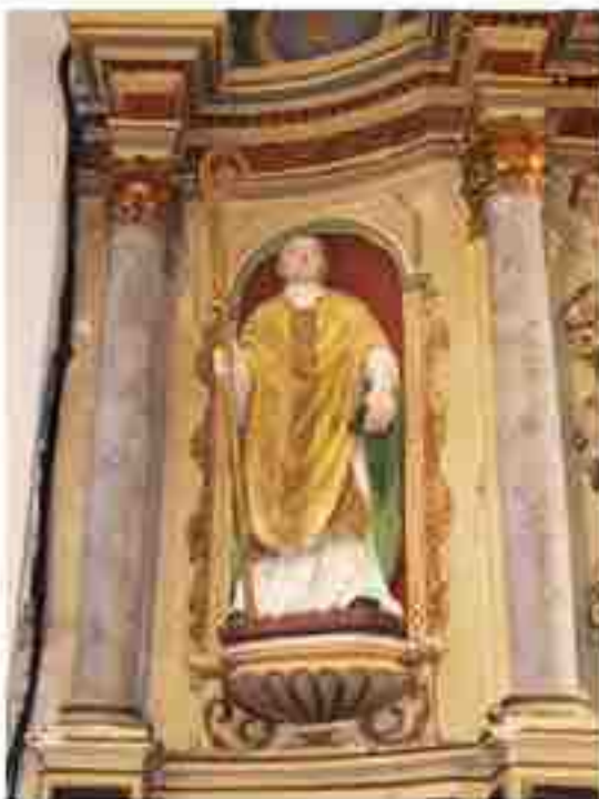
Eglise Saint-Brandan Trégrom

La tradition le fait voyager en Ecosse, fonder un monastère sur l'île d'Arran et visiter d'autres îles. D'après Adoman, il aurait rencontré saint Colomba sur l'île d'Hynba en Ecosse et serait même allé en Bretagne armoricaine avec st Malo, un moine gallois, rendre visite à st Gildas.