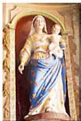
N-D du Rosaire Trégrom (église)

Reine de l'Arvor, nous te saluons Vierge Immaculée, en toi nous croyons.