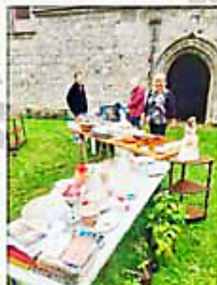
Le comité de l'association vous propose aussi Café et thé

Franc succès aussi rencontré pour les Journées du Patrimoine.